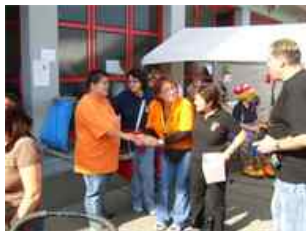
Die 500'ste Typisierung ist angekommen