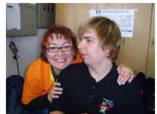
Unser Super Kassenteam